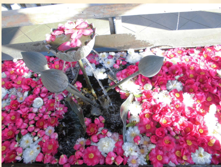
手水舎がきれいでした