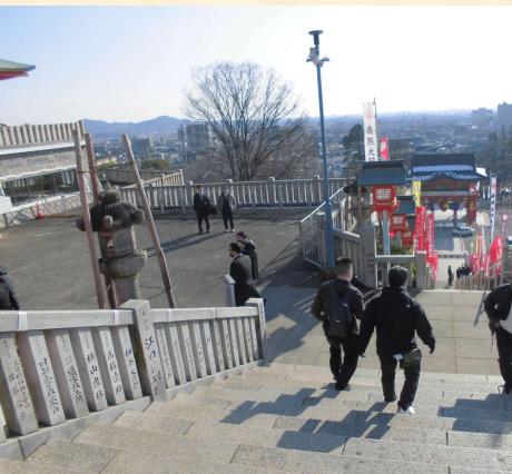
成田山の階段チャレンジ！（166段）